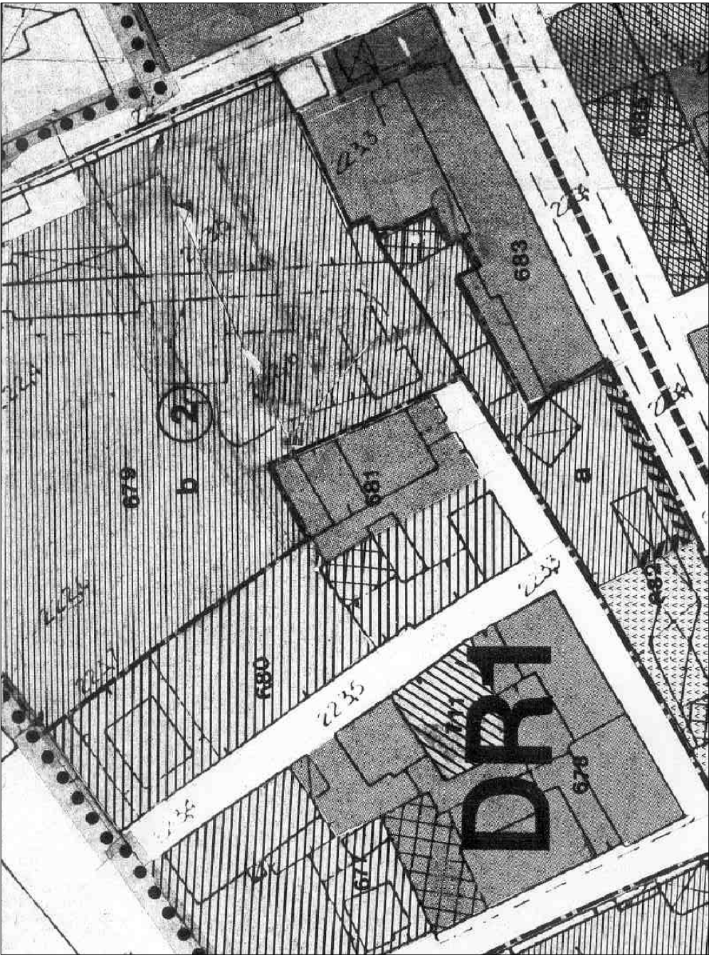
ESTRATTO CATASTALE 1:1500