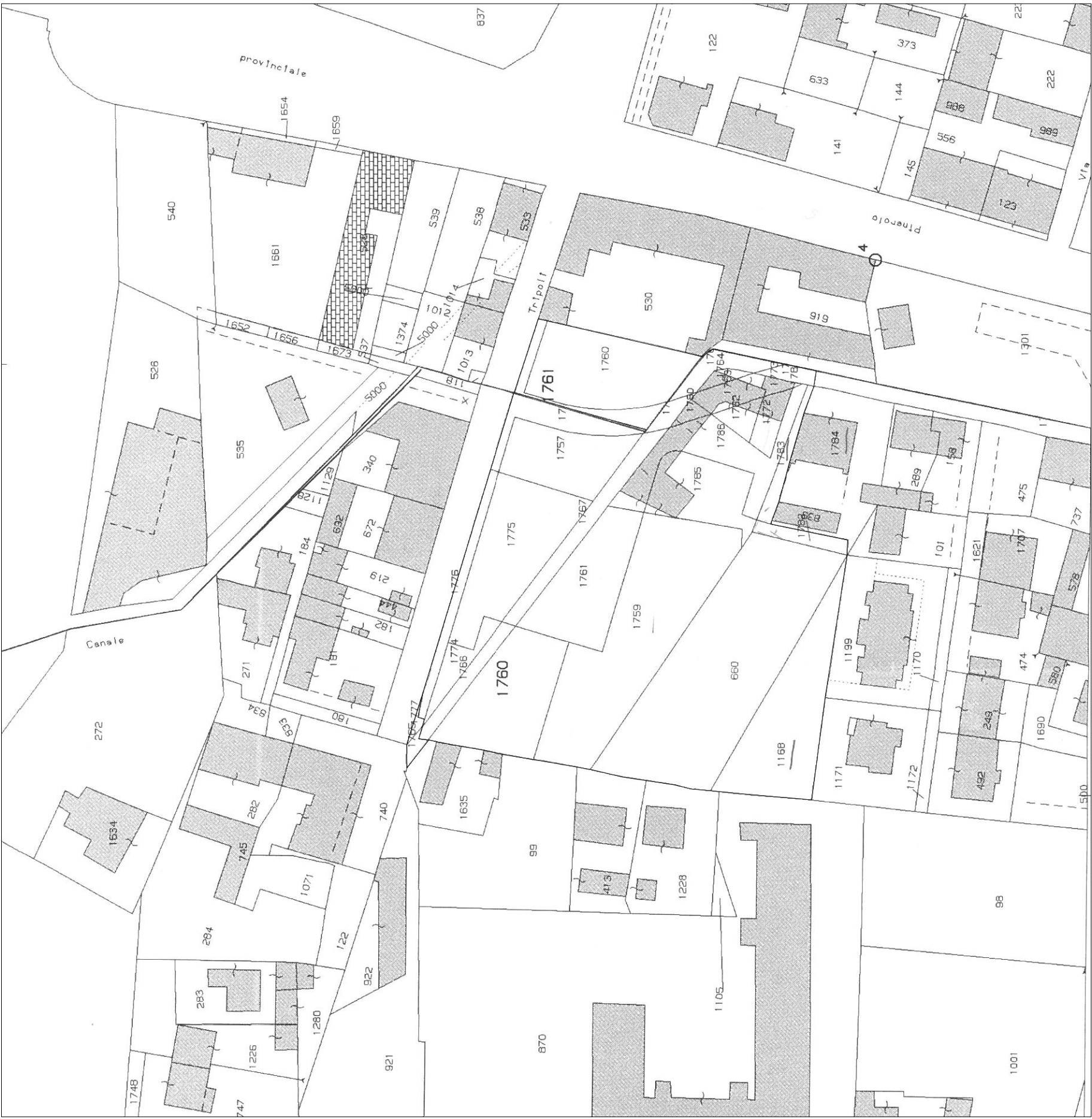
Fg. 5 e Fg. 6

Particelle catastali all'interno della superficie territoriale